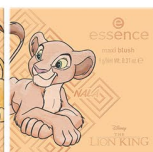
02 Can you feel the love tonight?