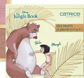
020 Wild About You