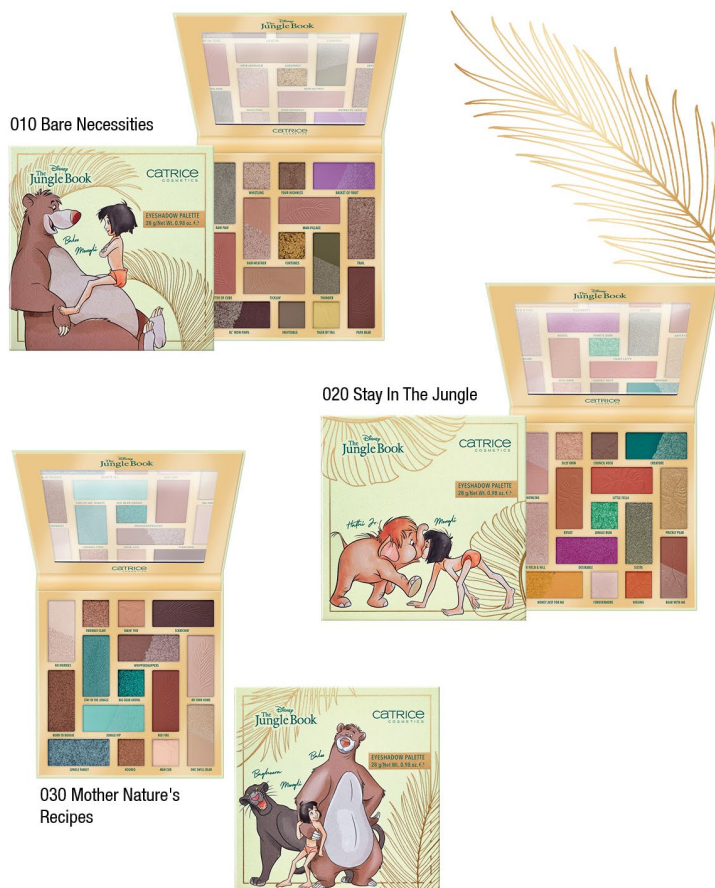
010 Bare Necessities