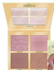
010 Tales About The Jungle