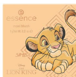
01 Remember who you are