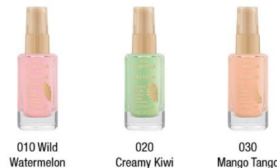
010 Wild Watermelon