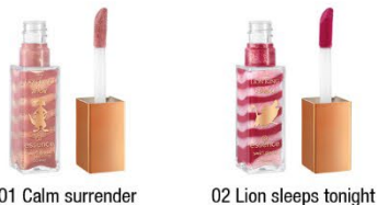
01 Calm surrender