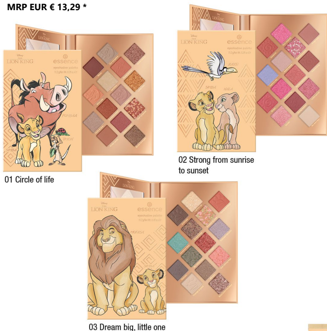
01 Circle of life