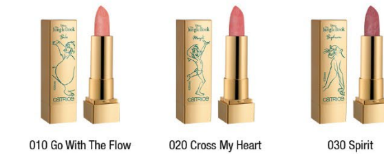
010 Go With The Flow