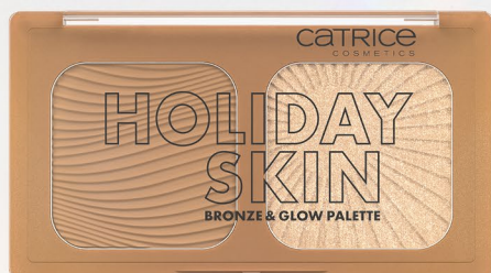
010 Out Of Office