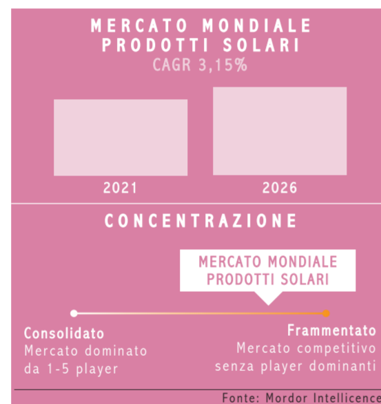
Dimensione (%) del mercato dei prodotti solari nel mondo, nel 2020

E in effetti la multifunzionalità è una delle principali caratteristiche dei prodotti presentati nelle pagine seguenti. Se la protezione è prerogativa indiscutibile, i solari di oggi vantano inoltre proprietà idratanti, rigeneranti, antiage, tonificanti, oltre che di accelerazione e prolungamento dell'abbronzatura. Ci sono referenze specifiche per labbra, capelli e anche per la salvaguardia dei tatuaggi. In formati sempre più pratici per l'uso on the go, e in texture leggere, non untuose, che non sbiancano la pelle e non lasciano tracce su corpo e indumenti. E' alta infine l'attenzione riservata alla selezione dei filtri solari e delle materie prime, con formulazioni a base di ingredienti naturali, spesso certificate bio e vegan. Spopolano, tra gli ingredienti, l'aloè, le vitamine e i vari acidi grassi (omega).